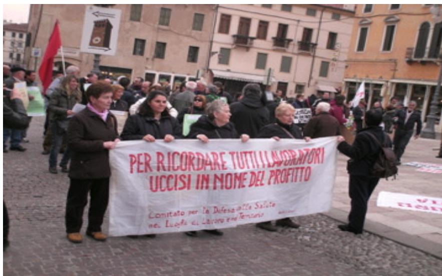
Il comitato in corteo a Bassano del Grappa

Il corteo, con centinaia di partecipanti (più di trecento), dopo aver sfilato per le vie della città si è concluso con una assemblea in cui ha preso la parola anche un rappresentante del nostro Comitato, dimostrando che la solidarietà è una potente arma.